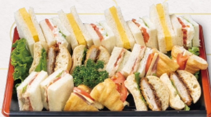
4 サンドイッチ 3,056円 (3~4人前) 32.5cm × 22cm 3,300円(税込)