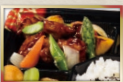
②デミグラスハンバーグ