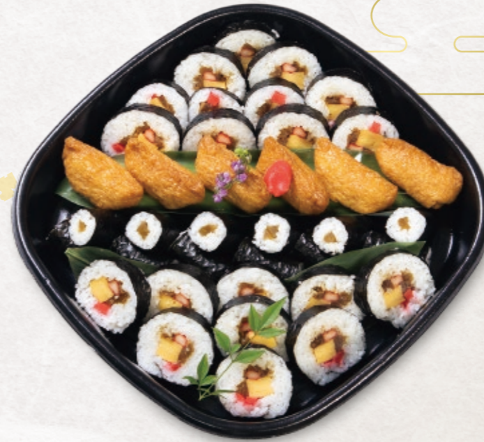
6 巻寿司盛り合わせ 2,963円 31.5cm × 31.5cm 3,200円(税込)