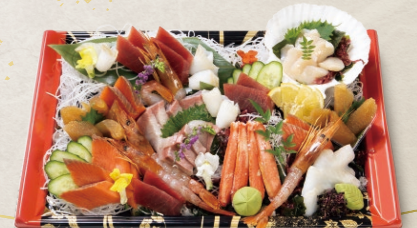
10 刺身盛り合わせ 9,722円 (4人前) 44cm × 30cm 10,500円(税込)

※時期や仕入れの状況によって、料理の内容は変更する場合がございます。予めご了承ください。