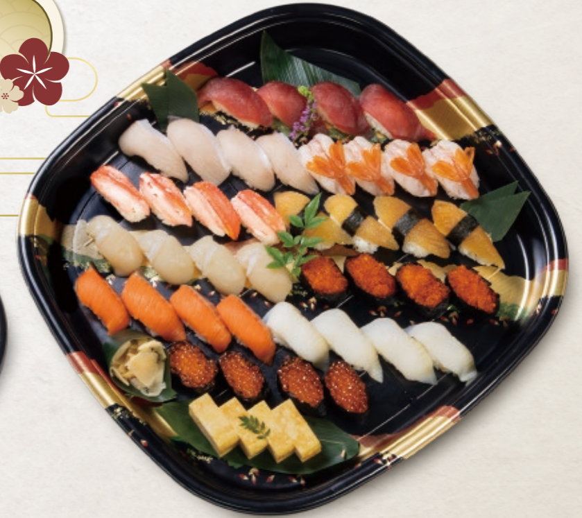
7 生寿司盛り合わせ 9,722円 (40貫) 36cm × 36cm 10,500円(税込)