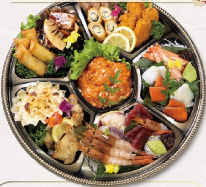
1 刺身入りオードブル 11,574円 (4人前) 直径 44.5cm 12,500円(税込)