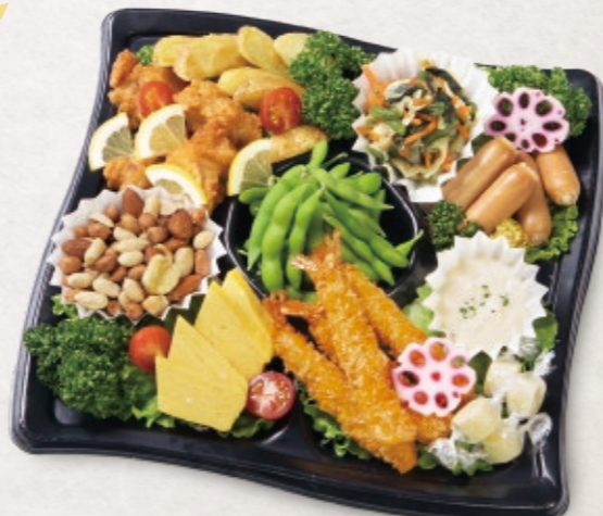
5 おつまみセット 3,056円 (3~4人前) 31cm × 31cm 3,300円(税込)