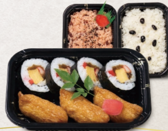
9 助六寿司 / 各 648円 赤飯 / 黒飯 700円(税込) ※セット商品ではございません。