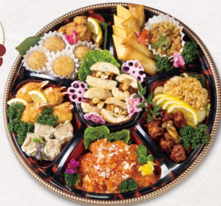
2 中華オードブル 9,722円 (4人前) 直径 44.5cm 10,500円(税込)